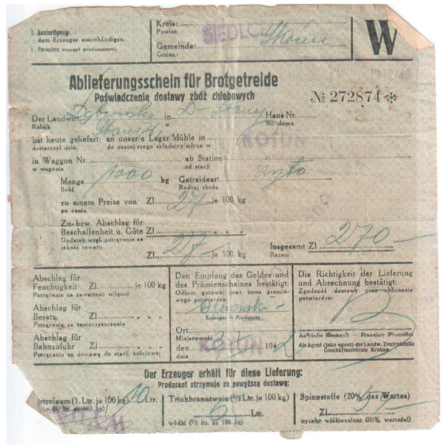
1. „Poświadczenie dostawy zbóż”