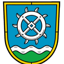
GMINA MÜHLENBECKER LAND