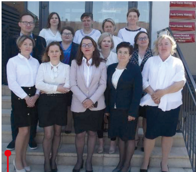
Kadra Gminnego Ośrodka Pomocy Społecznej w Skórcu